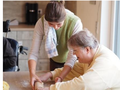
Adventsfeier und Plätzchenbacken im Wohnhaus Hainburg

Das kulturelle Programm kam im Wohnhaus Hainburg ebenfalls nicht zu kurz. Die Märchenfestspiele mit den „Bremer Stadtmusikanten“ und Konzerte des Hanauer Kultursommers waren Teil des Programms. Die Bewohner*innen freuten sich unter anderem über die Auftritte von Giovanni Zarella und ABBA Night. Aber es wurde im Wohnhaus Hainburg nicht nur gefeiert. Nudeln selbst zu machen, sich im großen Garten zu betätigen oder Memory zu spielen machte den Bewohner*innen immer wieder großen Spaß.