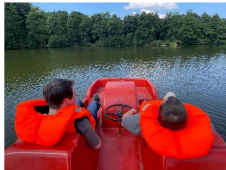
Ausflüge und Aktivitäten der Bewohner*innen der Wohnanlage Obertshausen

Der Förderverein sorgte zudem dafür, dass sich die Wohngruppen über neue Fernseher freuen durften, der Eingangsbereich mit neuen Bänken ausgestattet wurde sowie eine neue Couch und ein Grill angeschafft wurden. Um die Bewohner*innen auch mit dem Fahrrad im Sozialraum begleiten zu können, wurde mit Hilfe des Repair-Cafés Obertshausen ein Betreuerfahrrad organisiert.