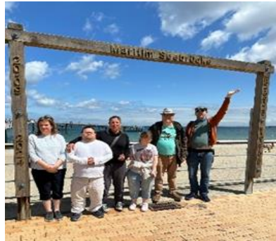
Bewohner*innen der Wohngruppe Rodgau bei der Urlaubsfreizeit

Auch kulturell bot das Jahr ein besonderes Highlight: Der Besuch der Schlagernacht in Frankfurt sorgte für große Begeisterung und bleibt vielen Bewohner*innen als emotionaler und musikalischer Höhepunkt in Erinnerung.