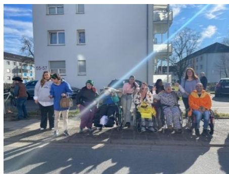
Stadionbesuch beim OFC und Besuch des Faschingsumzugs von Bewohner*innen der Wohnanlage Obertshausen

Ein besonderes Highlight des Jahres war das Sommerfest. Gemeinsam mit Angehörigen und Freunden feierten die Bewohner*innen und Mitarbeiter*innen bei ausgelassener Stimmung. Wie immer gab es leckeres Essen und eine Band sorgte für beste Unterhaltung.