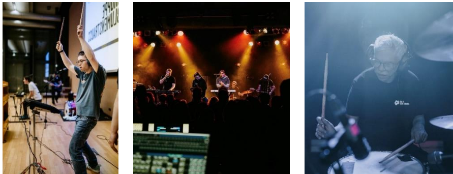
Impressionen von Live-Auftritten der Band Gruppe Blumenstrauss

Die inklusive Band „Gruppe Blumenstrauss“ mit vier Mitgliedern aus den Wohnverbund Offenbach blickt auf ein erfolgreiches Jahr zurück. Bei 13 Auftritten vor allem in Hessen, aber auch in Bonn, Berlin, Jena und Karlsruhe, konnte die Formation mit ihren energiereichen Songs wieder viele Zuschauer*innen davon überzeugen, dass Inklusion auch musikalisch ein Gewinn für alle ist. Besondere Highlights waren der Auftritt zum 50-jährigen Jubiläum der BHO und Auftritte auf dem Nonstock-Festival oder am alten Zoll in Bonn.