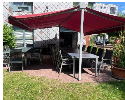
Begeisterung über das neue Gewächshaus und die Terrassenmöbel in der Wohnanlage Offenbach

Zudem begrüßen die Bewohner*innen gefiederten Zuwachs. Im Garten der Wohnanlage Offenbach haben Hühner ein neues Zuhause gefunden. Darüber hinaus freuen sich die Bewohner*innen über ein neues barrierefreies Fahrzeug, das durch die Unterstützung des Freundes- und Förderkreises und der Helga-Moser-Kleffmann-Stiftung angeschafft werden konnte.