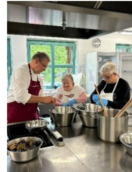
40-Jahre Wohnanlage Offenbach mit vielen Gästen und Live-Band bei der Jubiläums-Gala und vorher Marmelade herstellen.

Des Weiteren fanden in der Wohnanlage Offenbach wieder zwei Kunstworkshops statt. Einige der Bilder wurden im Klingspor-Museum ausgestellt. Große Unterstützung gab es auch wieder durch den Freundes- und Förderkreis der Wohnanlage Offenbach. Dieser hat mit der Sparkasse Langen-Seligenstadt und dem Lions Club neue Terrassenmöbel, neue Hochbeete und ein neues Gewächshaus gespendet.