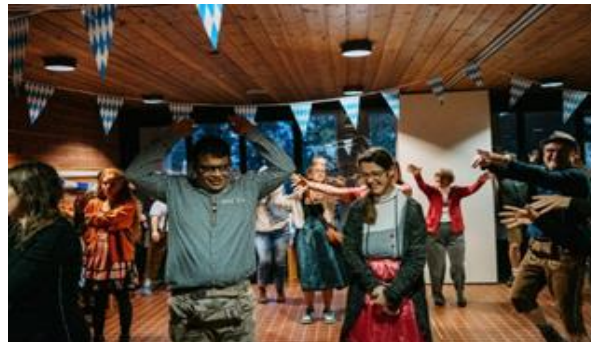
Oktoberfeststimmung im November beim Fest der Wohngruppe Rodgau mit vielen Gästen

Ein weiteres herausragendes Erlebnis stellte die Freizeitfahrt nach Hamburg dar, an der sechs Bewohner*innen teilnahmen. Neben einer Hafensrundfahrt standen zahlreiche Unternehmungen und gemeinsame Entdeckungen auf dem Programm, die allen Beteiligten unvergessliche Eindrücke und neue Erfahrungen ermöglichten.