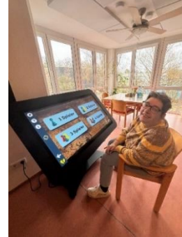
Übergabe des barrierefreien Fahrzeugs, Freude über die Hühner und das CareTable in der Wohnanlage Offenbach

Im Rahmen eines Social Days sorgten Mitarbeiter*innen der Deutschen Bank und von Amazon gemeinsam mit Bewohner*innen und Mitarbeiter*innen der Wohnanlage für eine Verschönerung des Außengeländes. Ebenfalls bedanken wir uns wieder beim Rikscha Team vom Freiwilligen Zentrum Offenbach, die regelmäßig Ausflüge mit Bewohner*innen aus der Tagesstruktur durchführten.